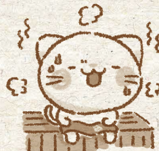
ベルーナ公式キャラクター 「べるーにゃ」